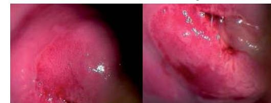
■ Kolposkopie - Grobe Punktion bei 5-9 Uhr